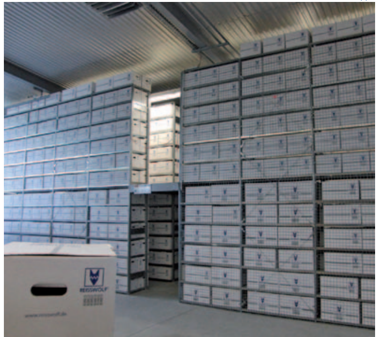
Ein Blick in die Archivhalle von REISSWOLF Ostwestfalen-Lippe