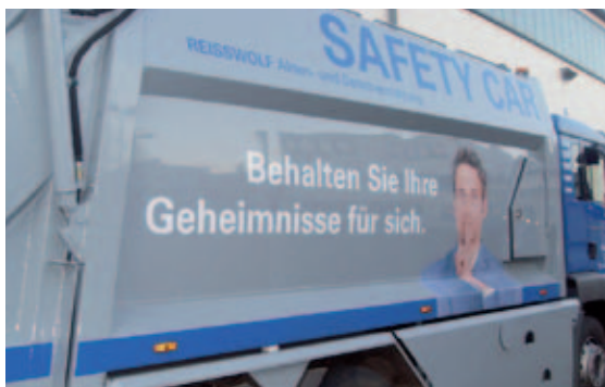
Ab sofort im Einsatz: der hochmoderne neue Sicherheits-Presswagen

REISSWOLF Hamburg stellt mit dem neuen „Safety Car“ eine technologische Weiterentwicklung zur sicheren Aktenvernichtung