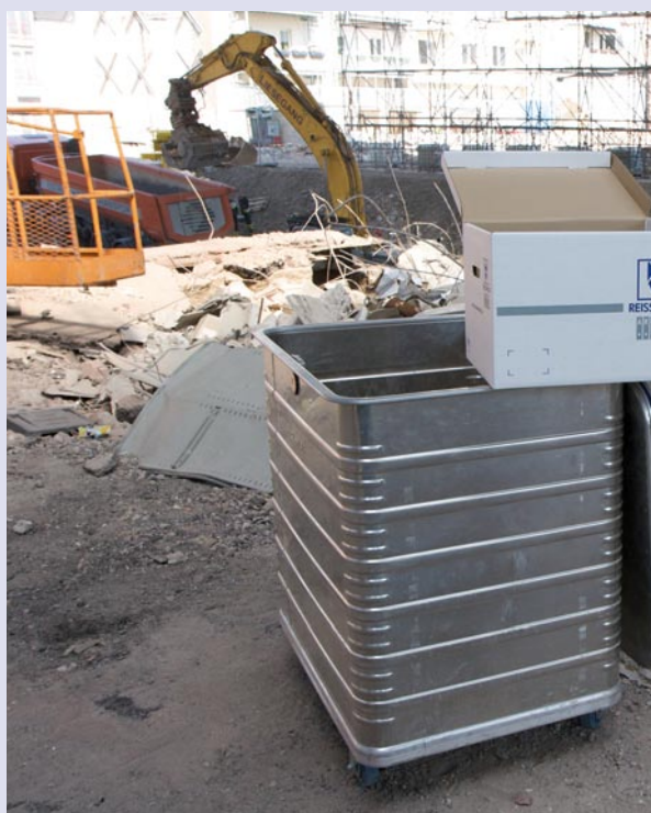
Robust, sicher und flexibel: der REISSWOLF Sicherheitsbehälter

Üblicherweise sammelt der Kunde darin Aktenordner, Hängeregister oder Schnellhefter, die dann zur Vernichtung zum nächstgelegenen REISSWOLF Betrieb transportiert werden. In Köln jedoch wurde er über Nacht zum heimlichen Star der Bergungsarbeiten: Denn er war sofort zur Stelle, als es hieß Dokument um Dokument aufzunehmen, vor Regen, Staub und Langfingern zu schützen und sicher zum nächsten Bestimmungsort zu transportieren. Er ist der perfekte Bodyguard auf Rollen. ■